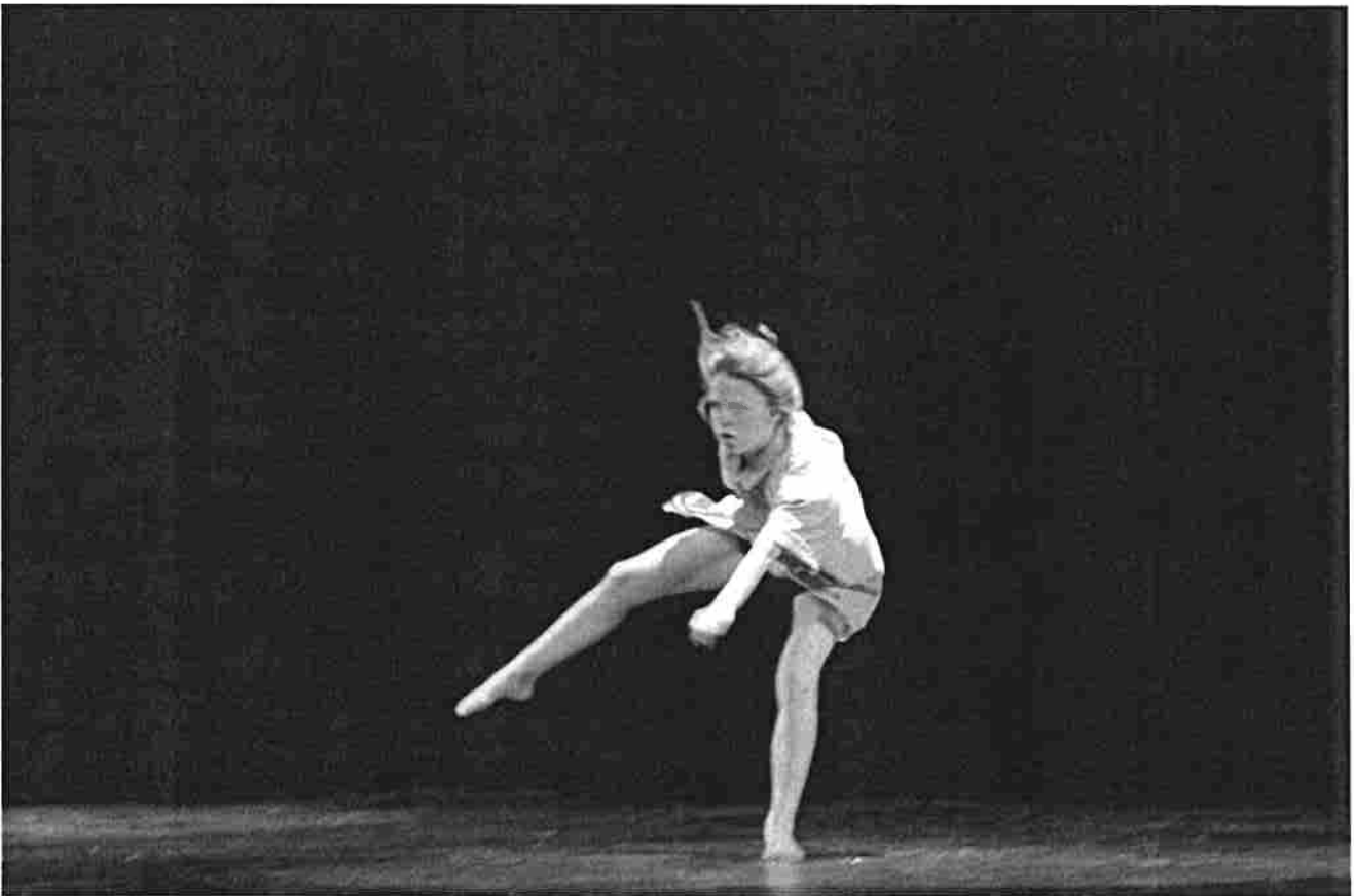
Élève de première du Lycée Bréquigny- Rennes- 2014